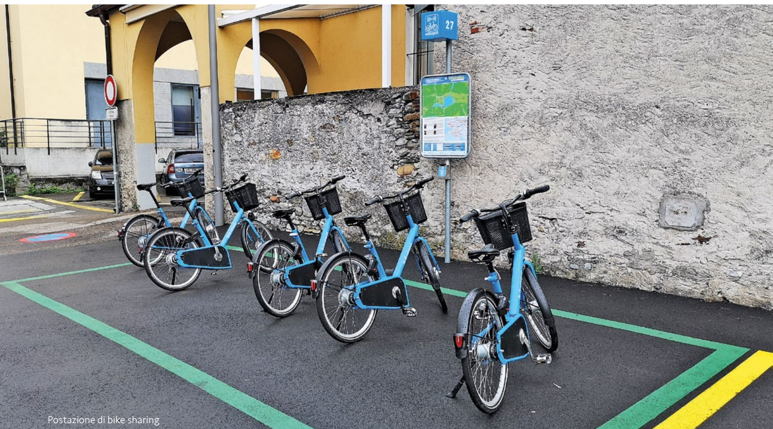
Postazione di bike sharing

politica energetica all'avanguardia. Ad inizio 2018 è stato creato l'Ufficio energia comunale, che serve anche quale sportello di consulenza alle aziende locali e alla cittadinanza, questo perché il tema ambientale non può essere confinato al livello politico, ma deve richiamare ogni singolo individuo a comportamenti responsabili e consapevoli. Inoltre, nel 2018, è stato approvato il regolamento comunale concernente l'erogazione di incentivi in favore del risparmio energetico, dell'uso di energie rinnovabili e della mobilità sostenibile, che prevede sostegni finanziari a favore dei proprietari immobiliari che scelgono di analizzare dal punto di vista energetico i loro edifici o che decidono di convertire impianti di riscaldamento vetusti con ad esempio delle più efficienti termopompe e che prevede sempre sostegni finanziari a favore del bike sharing, di stazioni di ricarica domestiche per vetture elettriche e per l'acquisto