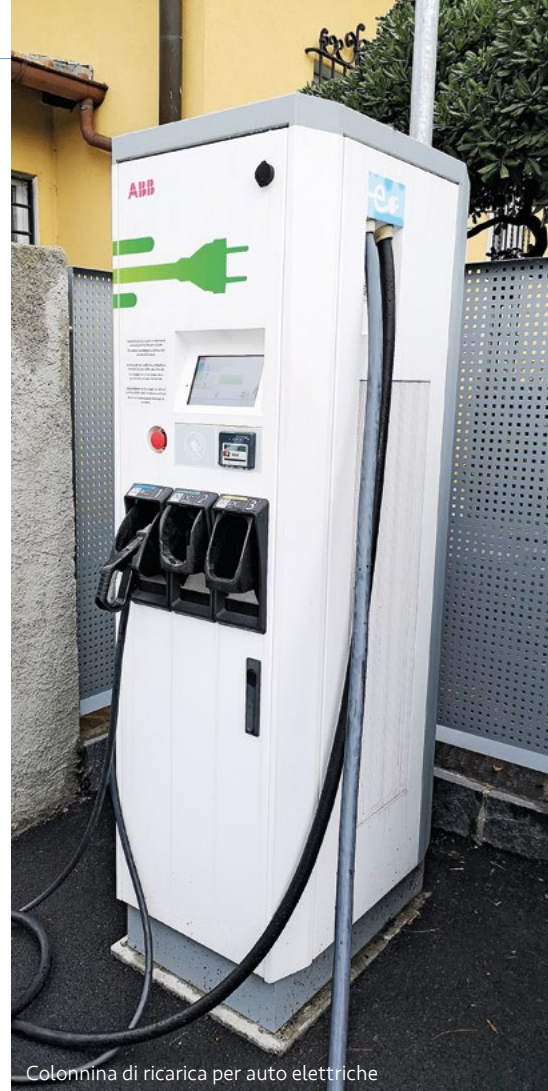
Colonnina di ricarica per auto elettriche

Zu Beginn des Jahres 2018 wurde das Gemeindeamt für Energie geschaffen, welches auch als Schalter zur Beratung der örtlichen Betriebe und der Mitbürger dient. Im 2018 wurde auch das Gemeindegremium betreffend die Bereitstellung von Anreizen zugunsten einer Energieeinsparung, der Nutzung von erneuerbaren Energien und der nachhaltigen Mobilität verabschiedet, welches eine finanzielle Unterstützung zugunsten Immobilieneigentümer vorsieht, die bereit sind, aus energetischer Sicht ihre Gebäude zu analysieren und beschliessen, ihre veralteten Heizungsanlagen durch nachhaltigere zu ersetzen. Weiter wurden finanziell unterstützt: Bike Sharing, Ladestationen zu Hause für Elektrofahrzeuge sowie der Erwerb von E-Bikes. Die Strategie vergisst auch nicht den Hotelsektor, welcher