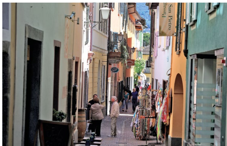
Alcuni scorci delle vie e delle piazze del nucleo storico del Borgo di Ascona