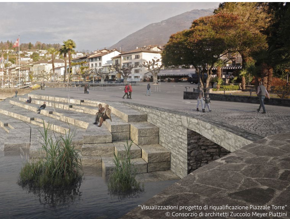
“Visualizzazioni progetto di riqualificazione Piazzale Torre” © Consorzio di architetti Zuccolo Meyer Piattini