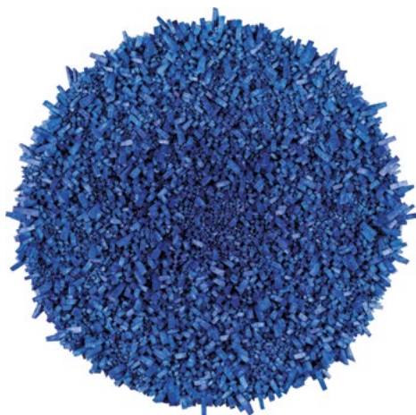
Chun_Aggregation 15-MY26 dalla mostra Colore Forma Vuoto-Contemplazione e meditazione nell'arte Contemporanea che si potrà visitare fino al 13.10.19

Da ultimo, con piacere, ricordo il riuscito esperimento della colorata invasione "Cracking Art" tra le vie del Borgo; un'esposizione originale che ha portato la cultura e l'arte tra la gente coinvolgendo tutti. Un progetto vincente che potrà essere ripetuto anche in futuro dato che i riscontri sono stati molto positivi, soprattutto tra i turisti stupiti che hanno postato centinaia di foto sui social