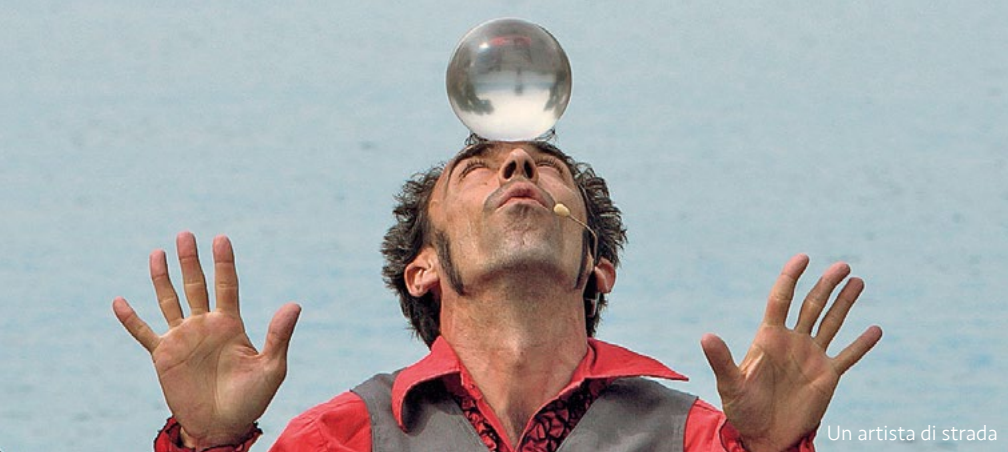
Un artista di strada