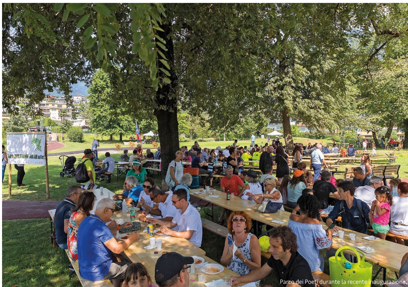
Parco dei Poeti durante la recente inaugurazione.