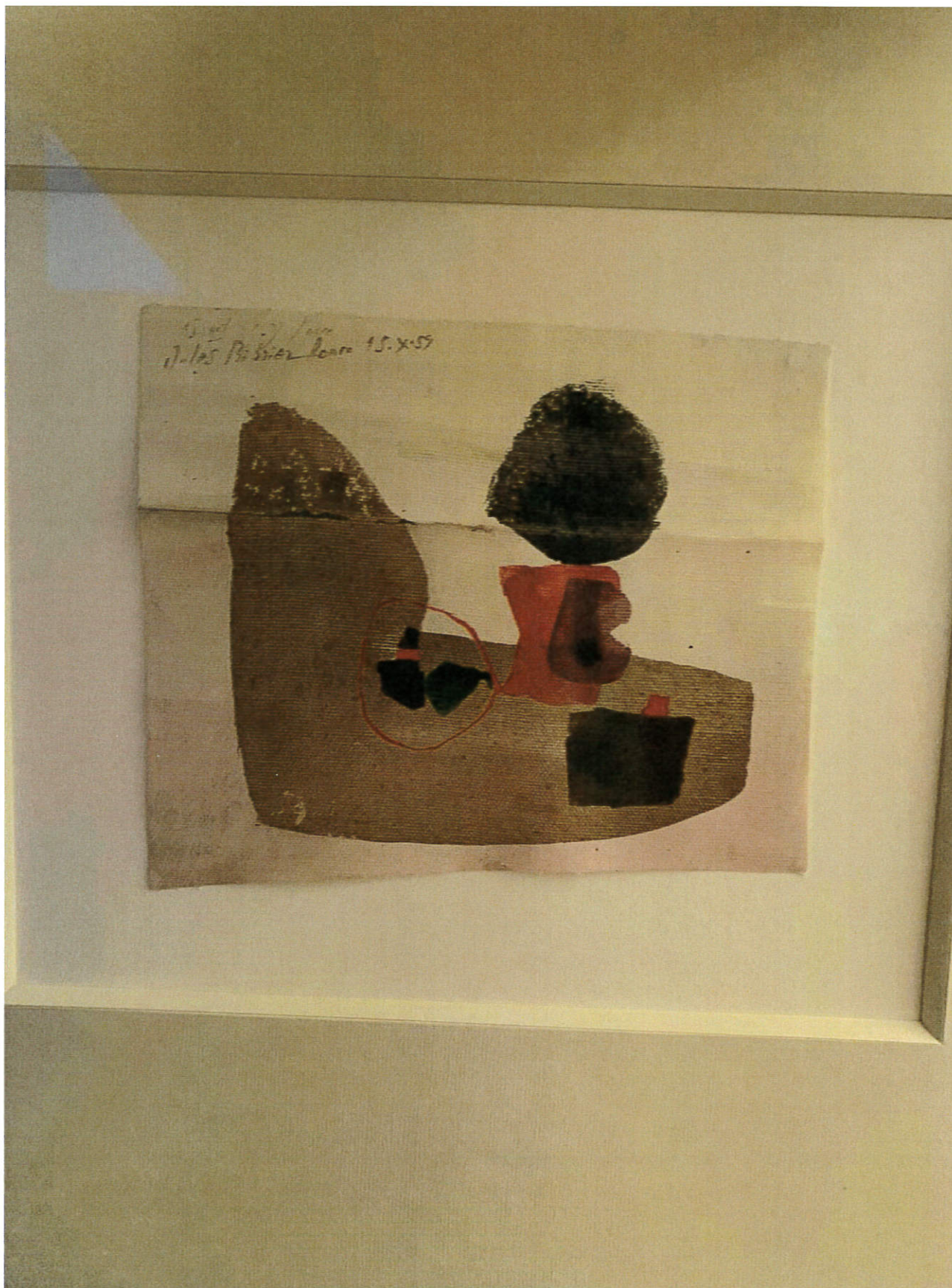
Titolo: 15 okt. Anno: 15 ottobre Firmato: Julius Bissier Dimensioni s.c.: 45 x 59 cm